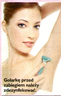
Golarkę przed zabiegiem należy zdezynfekować.

Odradzam natomiast przemywanie skóry spirytusem salicylowym. To może ją dodatkowo zaognić. Warto za to stosować (po dłuższym czasie od nałożenia maści odkażającej) preparat łagodzący podrażnienia (np. Alantan). Jeżeli jednak krostki po takiej kuracji nie znikną, konieczna będzie wizyta u dermatologa.