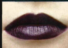
Szminka BORDO na ustach jest zmysłowa i elegancka. Wybierz najciemniejszą, jaką znajdziesz.