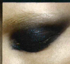
Czarne powieki + JASNE BRWI gwarantują supernowoczesny, „rockowy” efekt.