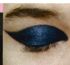
EYELINEREM narysuj na powiece kontur makijażu i wypełnij go w środku tym samym kolorem.